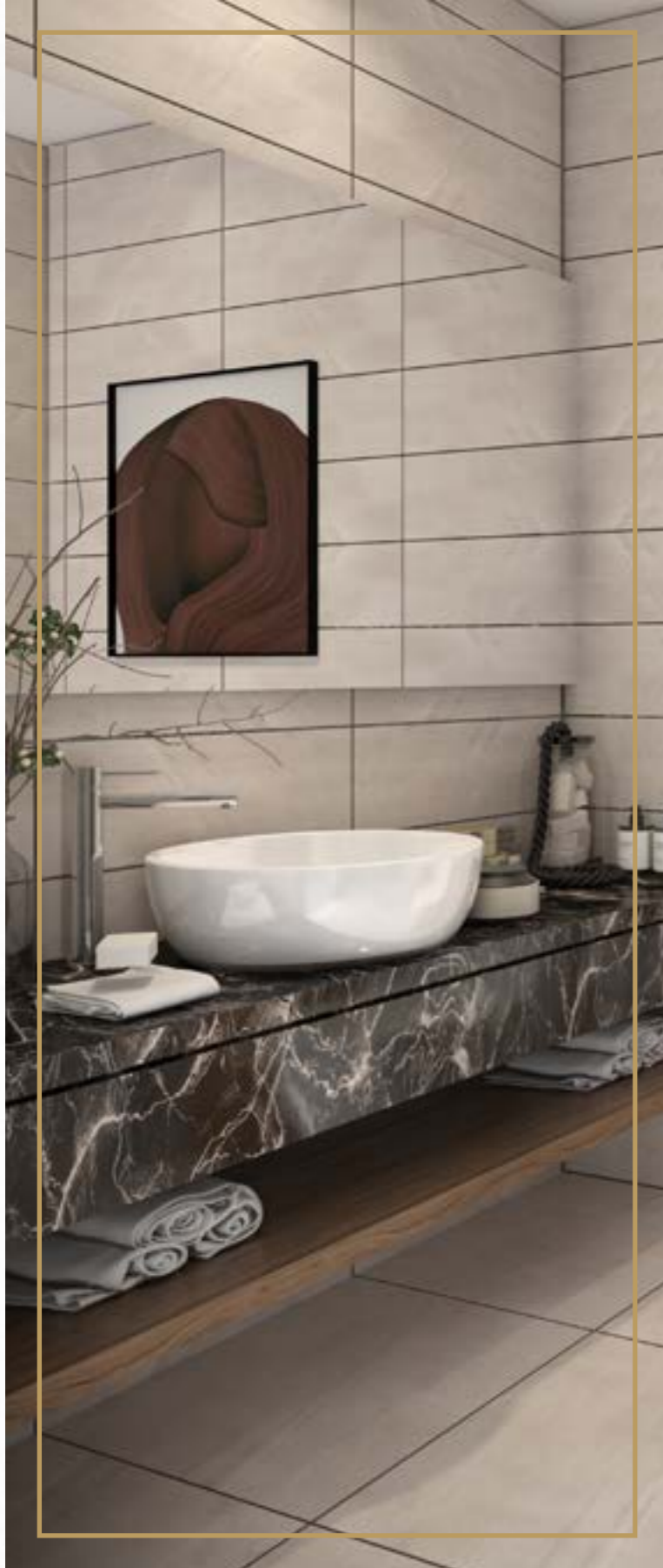
التأثيث الداخلي غير مشمول في المنتج النهائي، الصور لثانية الأبعاد مخصصة للأغراض التوضيحية وللتسويق