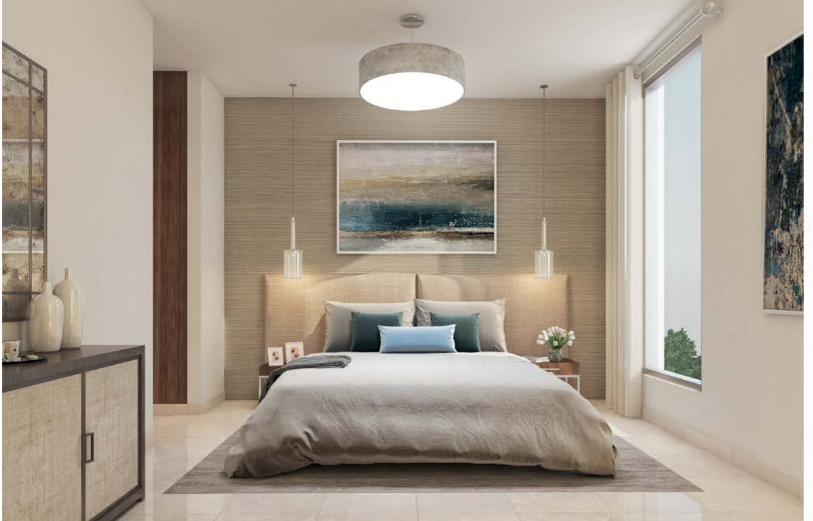
التأثيث الداخلي غير مشمول في المنتج النهائي، الصور ثلاثية الأبعاد مخصصة للأغراض التوضيحية وللتسويق