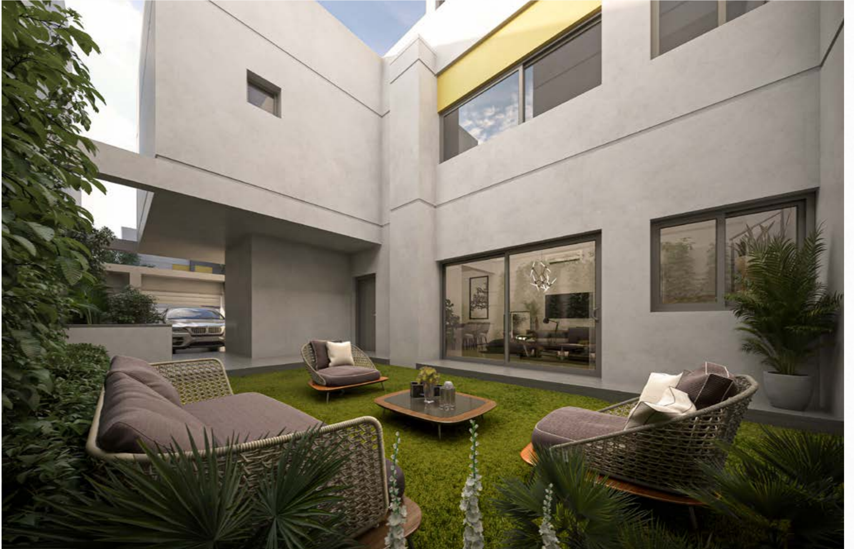
الحدائق غير مشمولة في المنتج النهائي، الصور ثلاثية الأبعاد مخصصة للأغراض التوضيحية وللتسويق