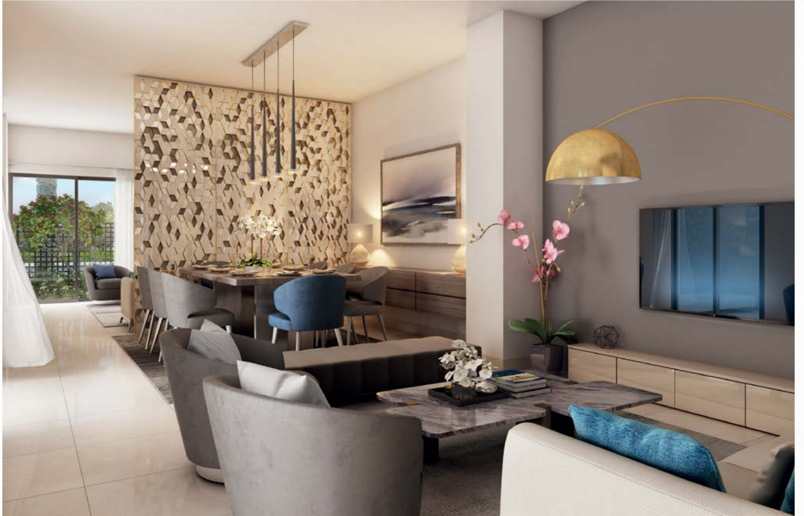
التأثيث الداخلي غير مشمول في المنتج النهائي، الصور ثلاثية الأبعاد مخصصة للأغراض التوضيحية وللتسويق