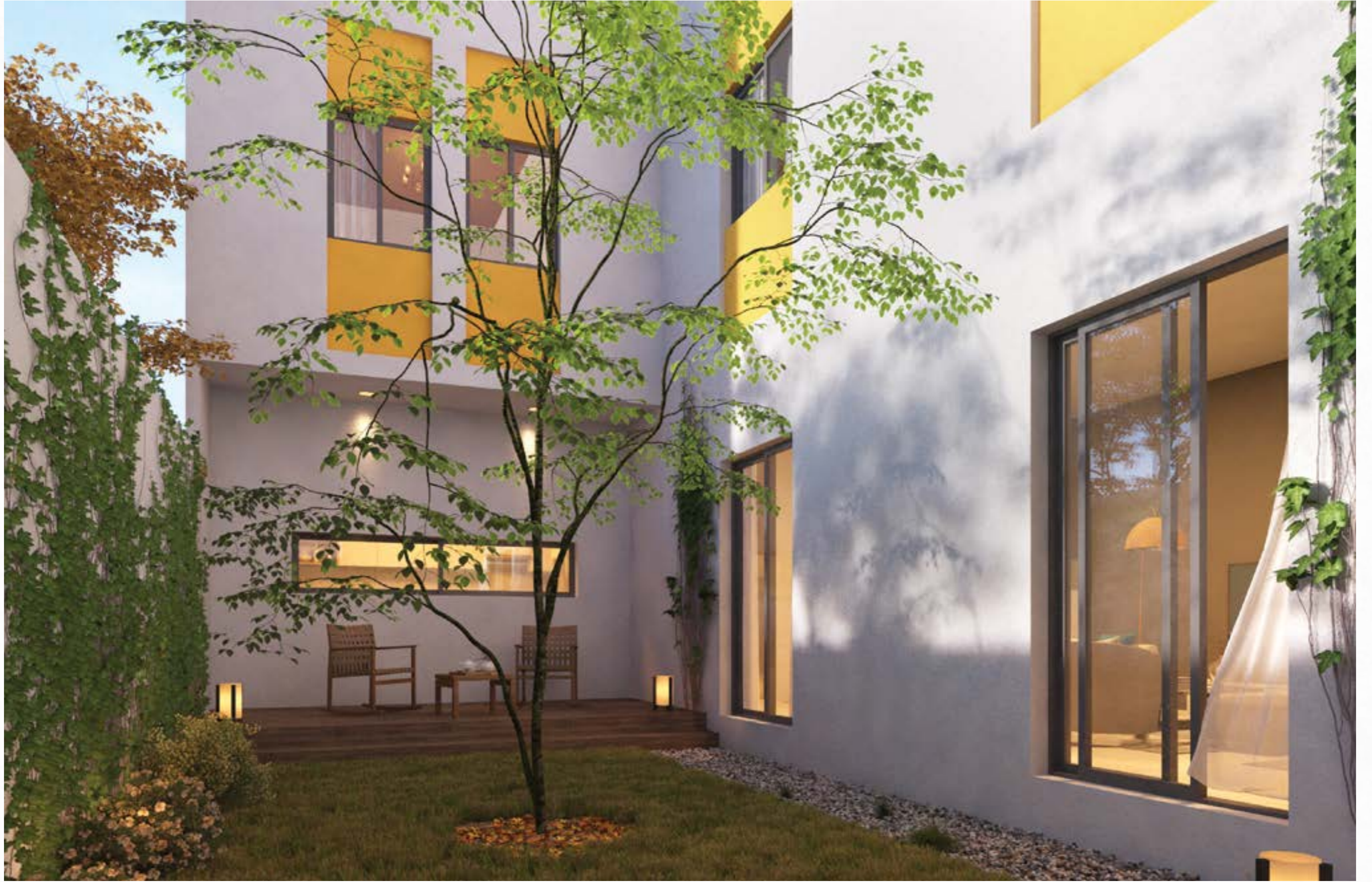
الحدائق غير مشمولة في المنتج النهائي، الصور ثلاثية الأبعاد مخصصة للأغراض التوضيحية وللتسويق