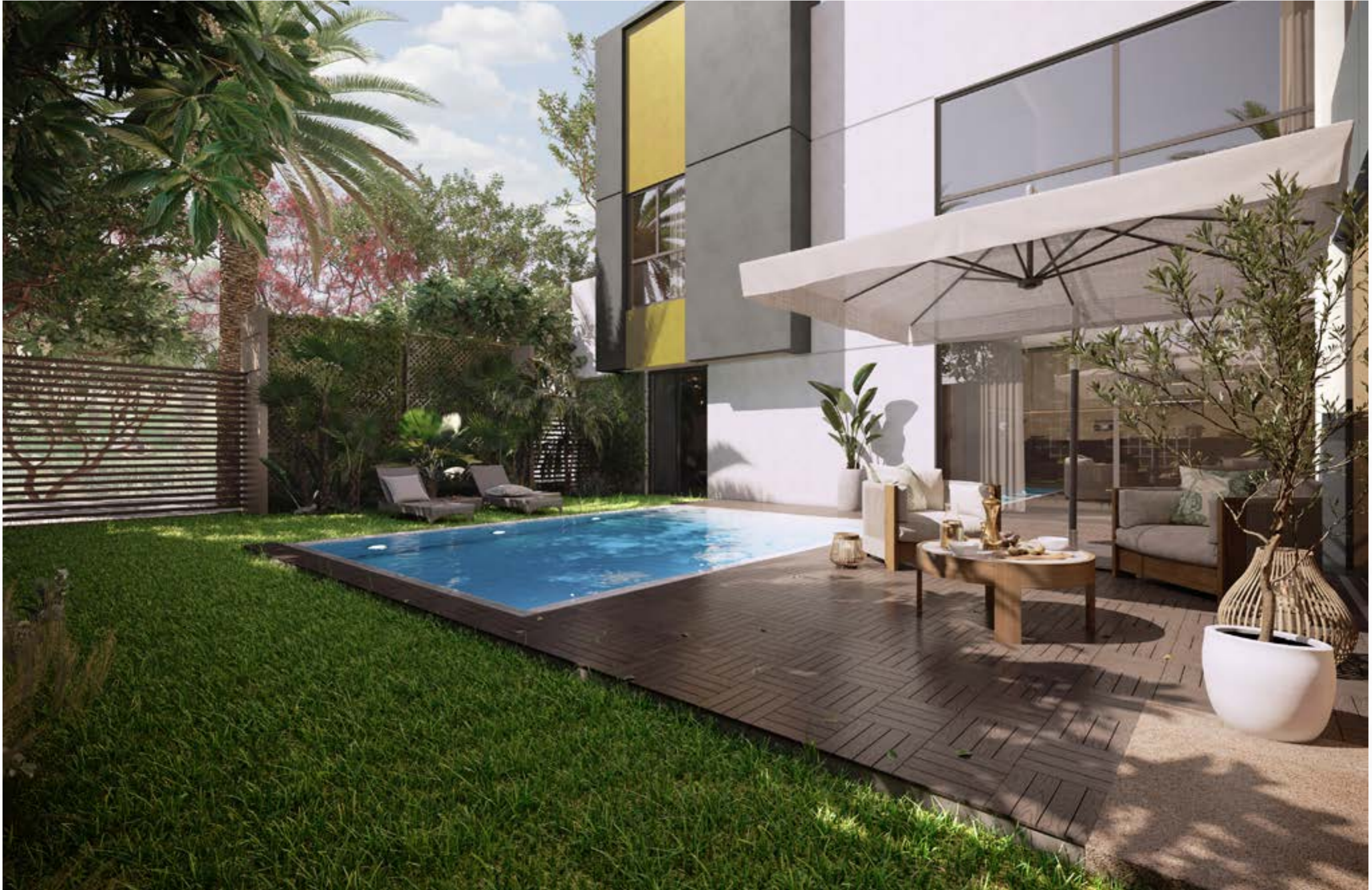
الحدائق والمساح غير مشمولة في المنتج النهائي، الصور ثلاثية الأبعاد مخصصة للأغراض التوضيحية وللتسويق