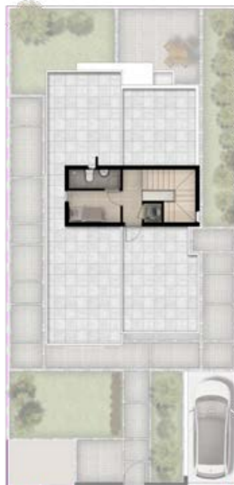
الدور الثاني 25.28 متر مربع

غرفة خادمة: 2.00x2.80 متر حمام: 2.10x2.80 متر