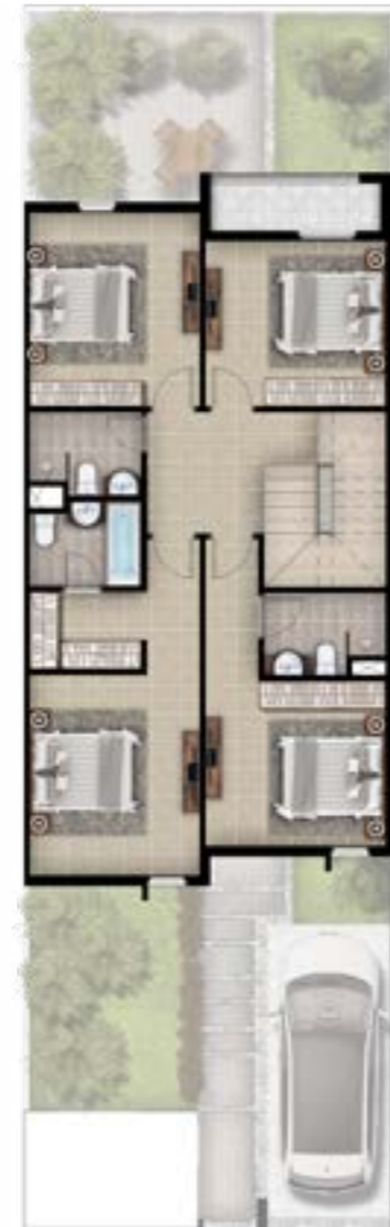
الدور الأول 86.80 متر مربع