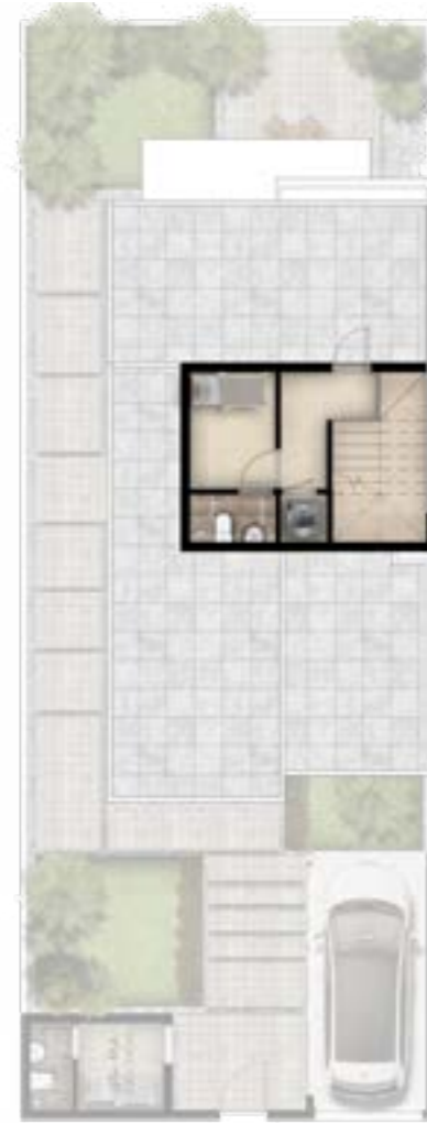
الدور الثاني 22.17 متر مربع

غرفة خادمة: 2.76x2.50 متر حمام: 2.76x1.10 متر