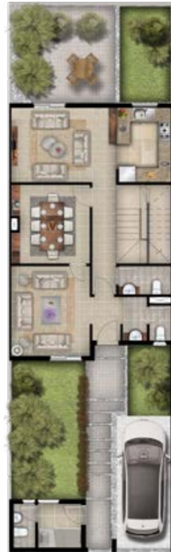
الدور الأرضي 91.80 متر مربع