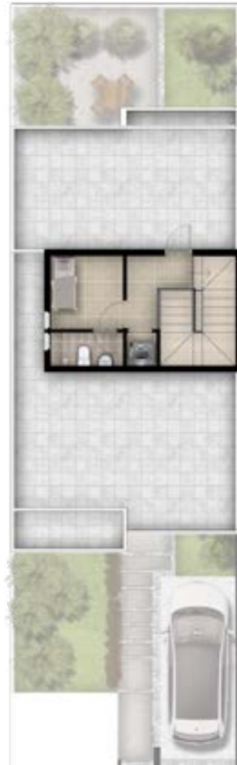
الدور الثاني 25.73 متر مربع

غرفة خادمة: 2.42x2.40 متر حمام: 1.10x2.40 متر