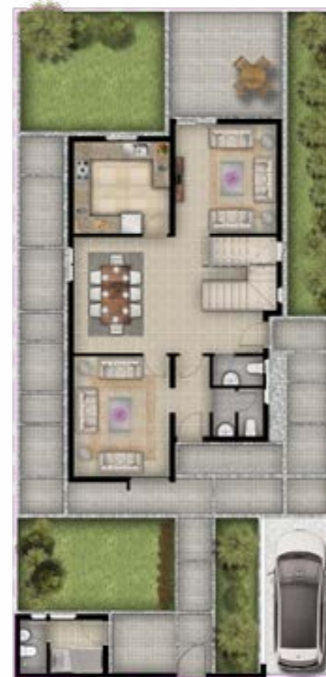
الدور الأرضي 105.92 متر مربع