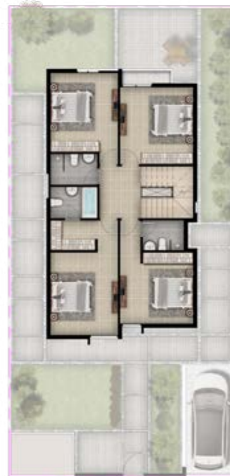
الدور الأول 119.19 متر مربع