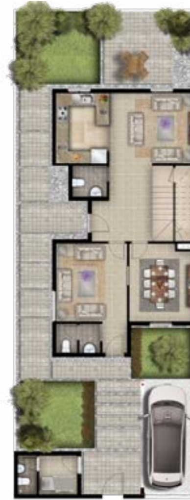
الدور الأرضي 97.90 متر مربع