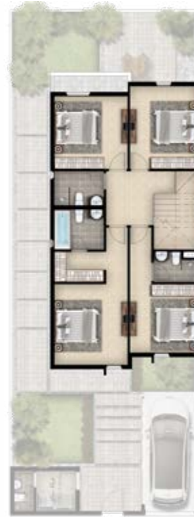
الدور الأول 103.72 متر مربع