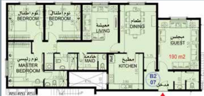
الشقة السكنية نموذج (B2)