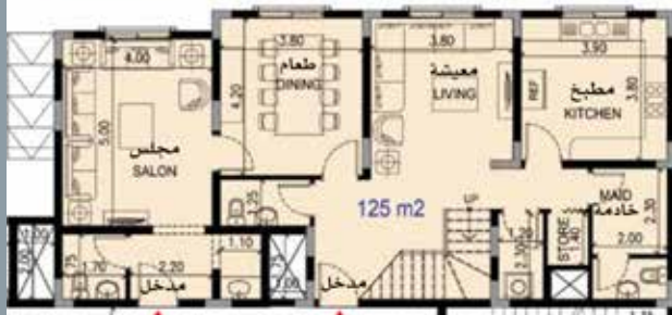
الشقة السكنية نموذج (C1)