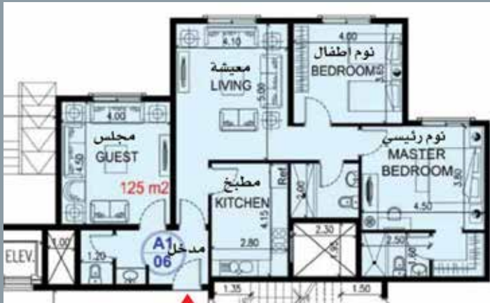
الشقة السكنية نموذج (A1)