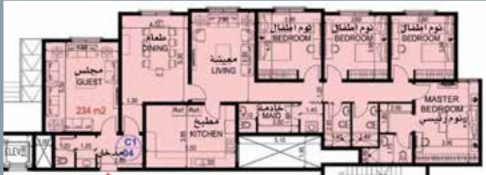
الشقة السكنية نموذج (C1)