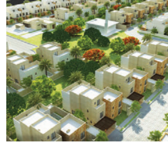
ضاحية الربابة - الرياض أحد مشاريع شركة رافال للتطوير العقاري