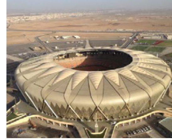
مشروع مدينة الملك عبد الله الرياضية (ملعب الجوهرة) - جدة أحد مشاريع شركة ثبات للإنشاءات